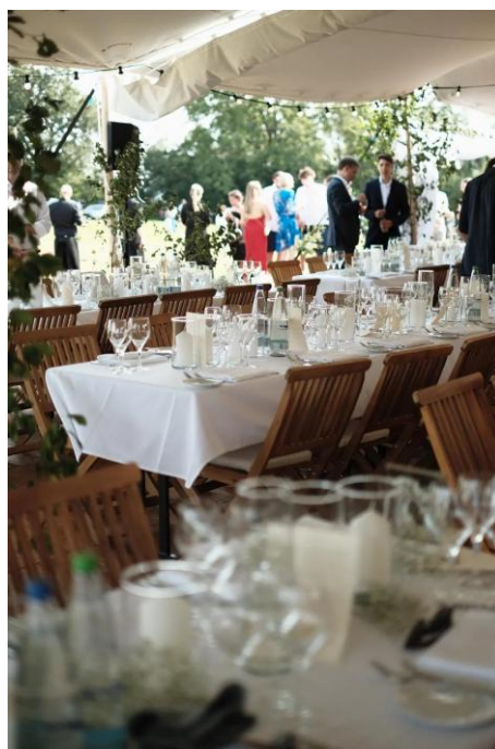
Zelt und Bild: Wemory.de