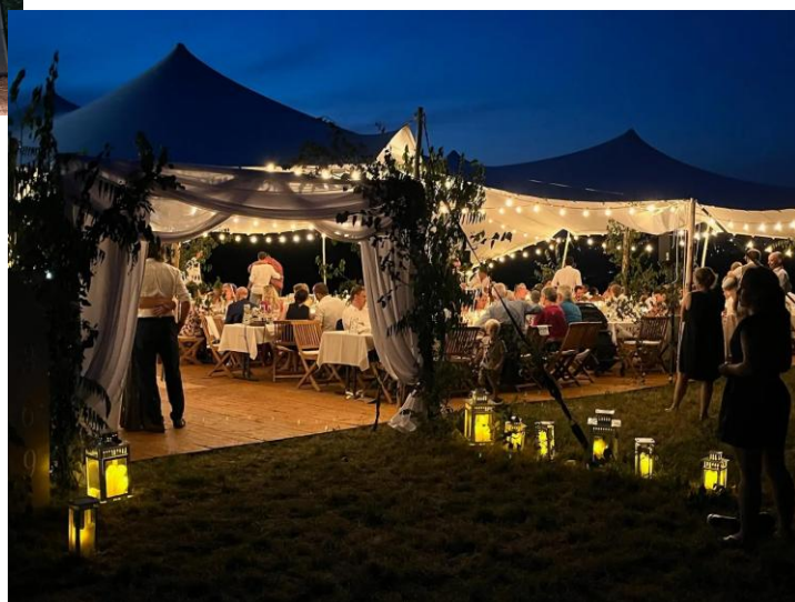
Zelt und Bild: Memory.de