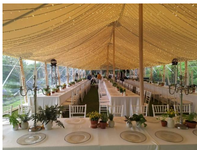
Zelt und Bild: Wemory.de